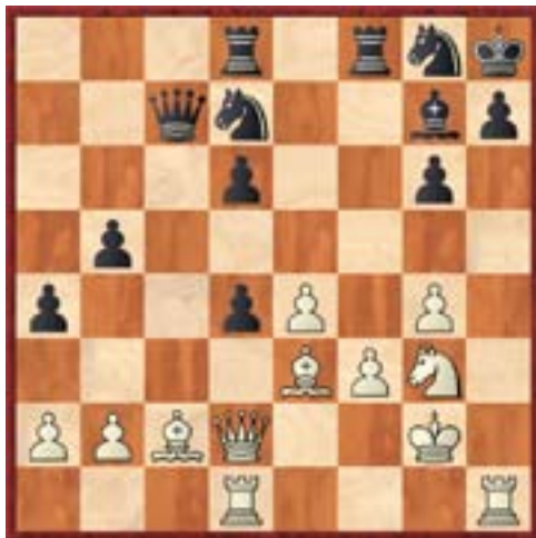
Posición tras 26 fxc6

Por su eventual trascendencia futura, reproducimos en este informe de balance ambas jugadas, reproducidas en el diario El País y comentadas por el especialista Leontxo García: