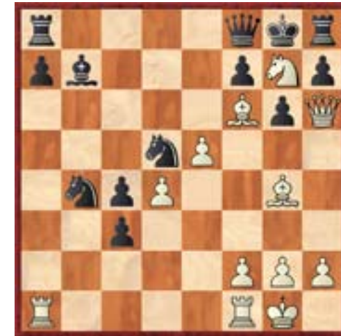
Posición tras 21 Af6