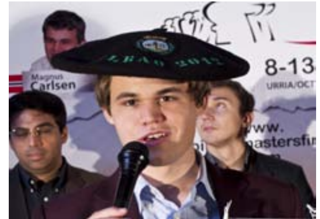
imagen exterior la difusión mediática de un evento del prestigio internacional del que la ciudad es sede fija.

La receptividad de todos grupos periodísticos sondeados fue muy positiva. Y no únicamente su receptividad, sino también -y lo que es más importante- la plasmación de una cobertura informativa sin precedentes de la Final de Maestros, en Sao Paulo y en Bilbao, tanto por el uso en la publicación y emisión de los contenidos multimedia que se les proporcionaron desde la organización como por la presencia física de los medios durante la disputa de las diez rondas que tuvieron como marco el Parque de Ibirapuera y Alhóndiga-Bilbao.